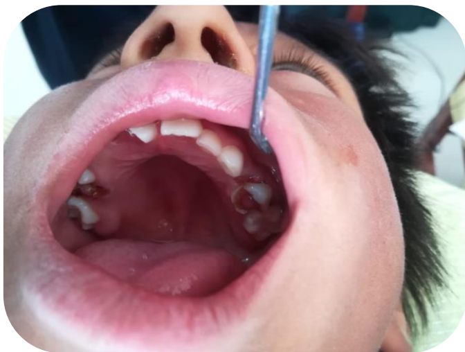
Het gebit van een van de jongste kinderen in Pumamarca